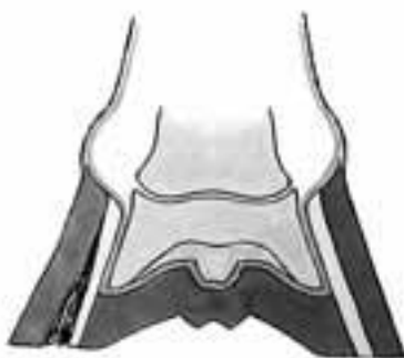
Schema eines Hufes mit einer hohlen Wand.

Unter einer hohlen Wand verstehen wir eine Zusammenhangstrennung innerhalb der Hornwand. Diese Trennung erfolgt in der Regel in den innersten Schichten der Horn-