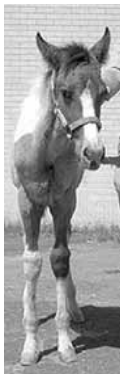
Abb. 5: Das gleiche Fohlen 2 Monate nach einer beidseitigen Wachstumsbeschleunigung aussen. Es steht nun auf geraden Vorderbeinen.

Verfasser: Prof. Dr. med. vet. Jörg Auer