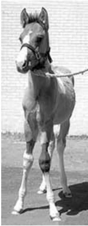
Abb. 3: Ein 2-monatiges Paint-Fohlen mit beidseitiger X-Beinigkeit vorne.