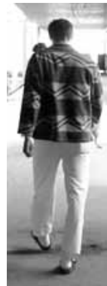
Abb. 2: Markante O-Beinstellung in einem ca. 45-jährigen Mann.

umgeben, der sich bei Belastung verdichtet.