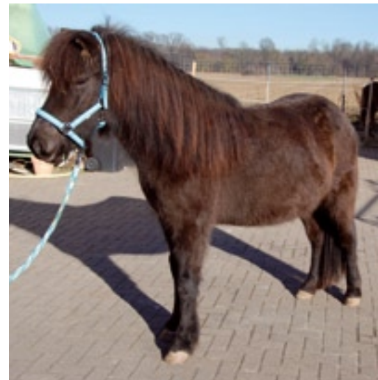
Abbildung 5 und 6: Wieder zu Hause!