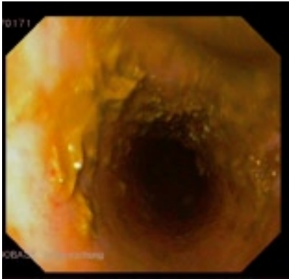
Abbildung 3: Endoskopie Luftröhre: Futterbestandteile in der Luftröhre infolge von Schluckbeschwerden.

Luftröhre befanden sich Futterpartikel (Abbildung 3). Die bakteriologische Untersuchung einer Luftsackspülprobe bestätigte einige Tage später die Diagnose Druse (Infektion mit Streptokokkus equi subsp. equi ). Um eine Ansteckung anderer Pferde in der Klinik zu vermeiden, wurde «Lif» in einer Isolierboxe untergebracht.