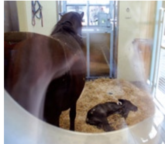
Abbildung 4: «Lif» und ihr neugeborenes Fohlen in der Isolierboxe.

Insgesamt dauerte «Lifs» Klinikaufenthalt im Tierspital 50 Tage, wobei sie während 27 Tagen ihr Fohlen bei Fuss hatte. 6 Monate später sind «Lif» und ihr Fohlen bei gutem Allgemeinbefinden. Der kleine Hengst ist von der Stute abgesetzt und auf einer Fohlenweide. «Lif» musste noch während einigen Monaten speziell gefüttert werden, kann jetzt aber wieder ganz normal fressen. Sie kann auch wieder aufbauend bewegt werden.