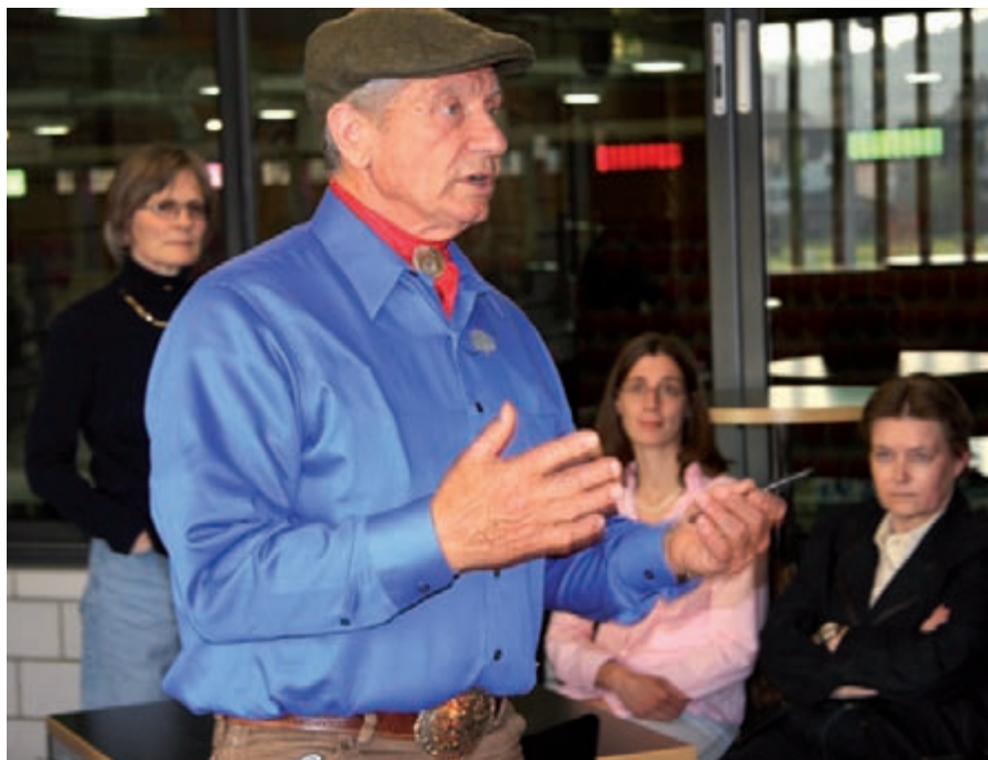
Monty Roberts bei der Mitgliederversammlung 2010