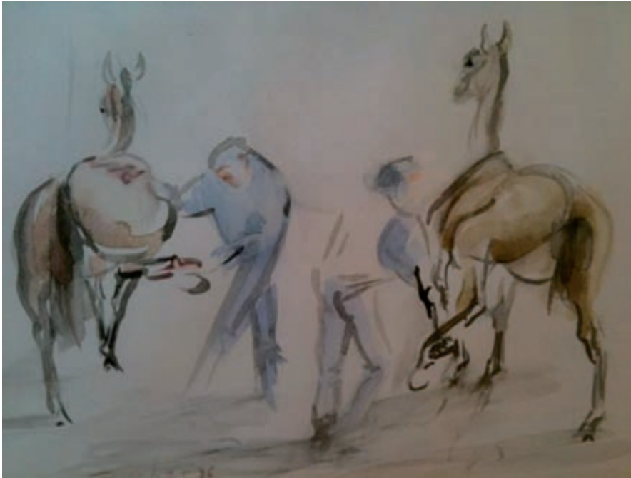
Isabelle Foucher, Aquarelle 1996, Dominique Giniaux

wiederzugeben. Im Pferderennsport kann häufig beobachtet werden, dass besonders gute Rennpferde mehr Kraft haben, als ihre Gelenke mechanisch vertragen können. Ihre Bewegungen in voller Aktion sind dann zu kraftvoll und zu weitläufig für ihre Gelenke, darum sind diese Pferde nach einem gewonnenen Rennen häufig steif. Deswegen ist es bei solchen «cracks» notwendig, regelmäßig ihre Wirbelsäule und Gelenke zu untersuchen, um sicherzugehen, dass sie bei großen Rennen ihr volles Potential entfalten können. Die durch Wirbelblockaden hervorgerufenen Muskelspasmen und Kontrakturen können sogar zur Reizung peripherer Nerven führen, die den Wirbelkanal durch die so genannten Zwischenwirbellöcher verlassen, wie z.B. den Ischiasnerv oder die Nerven im Bereich der Schulter, was zu Lahmheiten führen kann.