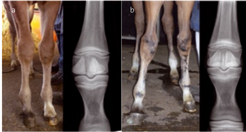
Abb. 3: a: Ein Fohlen der Gruppe 2 bei der Eintrittsuntersuchung (links Vorderbeine, rechts Röntgenbild der rechten Fesselgelenksregion); b: Gleiches Fohlen