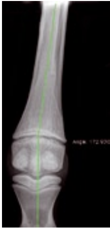
Abb. 2: Röntgenbild mit eingezeichneten Knochenachsen und Abweichungswinkel.