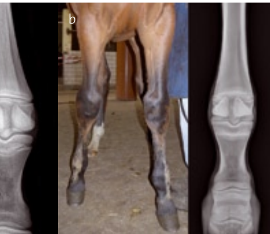
Fesselgelenksregion); b: Gleiches Fohlen und gleiche Gliedmassen 3 Monate später. Das Fohlen hat gut korrigiert.