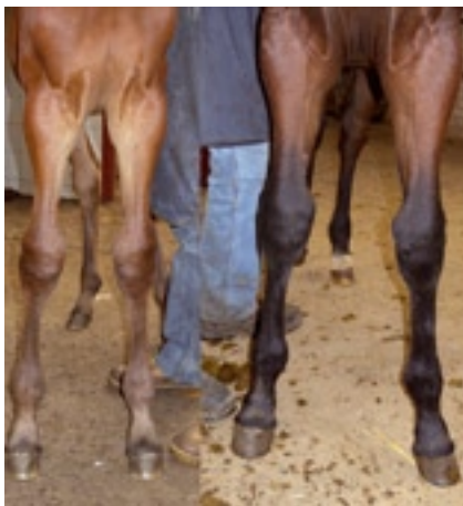
Abb. 5: Fohlen der Gruppe 6 vor der PTH-Injektion (links) und 3 Monate später (rechts). Das Fohlen hat gut korrigiert.

Die Autoren bedanken sich bei der Stiftung Forschung für das Pferd für die finanzielle Unterstützung dieser Studie, welche sehr wertvolle Daten für die Klinik ergab.