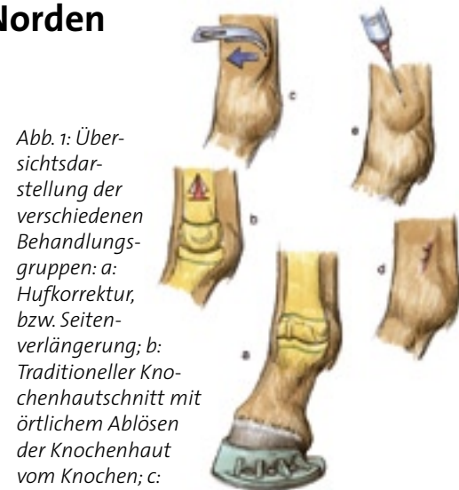
Abb. 1: Übersichtsdarstellung der verschiedenen Behandlungsgruppen: a: Hufkorrektur, bzw. Seitenverlängerung; b: Traditioneller Knochenhautschnitt mit örtlichem Ablösen der Knochenhaut vom Knochen; c: Transkutaner Knochenhautschnitt ohne Lösen der Knochenhaut; d: Unterbindung des Gefässes; e: PTH-Injektion.

Gruppe 1: keine Behandlung für 2 Monate, nur Beobachtung (falls nach 2 Monaten eine Restfehlstellung vorhanden war, wurden sie chirurgisch behandelt);