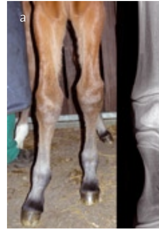
Abb. 4: a: Fohlen der Gruppe 4 bei der Erstuntersuchung (links Vorderbeine, rechts Röntgenbild der rechten

Gruppe 5: Unterbindung des zuführenden Gefäßes zur Wachstumsfuge. Das Gefäß wird mit dem Daumen durch die Haut identifiziert und anschliessend die Haut über 2cm eröffnet. Das Gefäß wird vorsichtig frei präpariert und an 2 Stellen unterbunden, gefolgt von der einschichtigen Hautnaht (Abb. 1c);