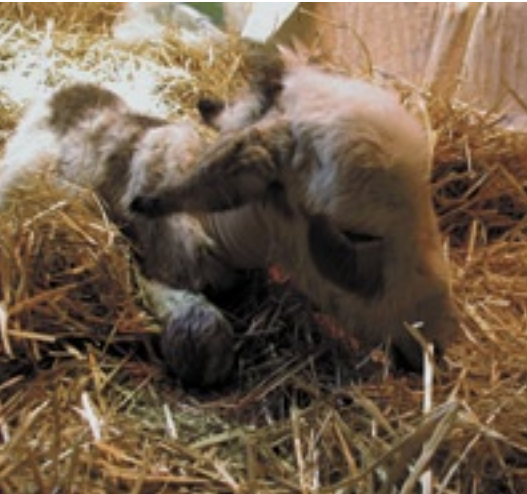
Unreifes Eselfohlen

Der erste Harnabsatz erfolgt zwischen 6 und 10 Stunden nach der Geburt. Auf den Absatz des Darmpechs und den ersten Harnabsatz sollte geachtet werden. Bleibt Harn- oder Kotabsatz aus, muss der Tierarzt informiert werden.