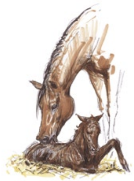
Unmittelbar nach der Geburt

Ein gesundes Fohlen hebt unmittelbar nach der Geburt den Kopf und richtet sich innert 1 - 3 Minuten in Brustlage auf. Der Saugreflex ist bereits 5 - 10 Minuten nach der Geburt