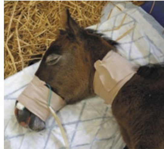
Fohlenintensivbetreuung an einer Klinik

In der Klinik wird das kranke Fohlen untersucht, mit Wärme, Flüssigkeit, Energie und bei IgG-Mangel mit Abwehrstoffen (Plasma) versorgt. Zusätzlich erhält es je nach Ursache der Erkrankung die nötigen Medikamente (z.B. Antibiotika). Das kritisch kranke Fohlen wird anschliessend sehr intensiv überwacht, was teilweise eine 24-Stunden Betreuung erfordert. Die meisten kritisch kranken Fohlen benötigen während des Klinikaufenthaltes eine Flüssigkeitstherapie. Meist handelt es sich dabei