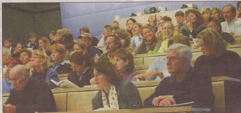
Aufmerksam verfolgen die Teilnehmenden die Vorträge der Experten.

Hat der Verkäufer keine schriftlichen Zusicherungen gemacht oder wurden die Gewährleistungsansprüche des Käufers schriftlich wegbedungen, haftet der Verkäufer nur, wenn er den Käufer absichtlich getäuscht hat. «Dieser 'Täuschungs-Paragraf' ist häufig der einzige Hoffnungsschimmer des Käufers», weiss Ulf Walz aus Erfahrung. «Allerdings muss der Käufer beweisen, dass der Verkäufer den Tatbestand in objektiver und subjektiver Hinsicht erfüllt hat – eine Beweisführung, die nur selten gelingt», klarer auf.