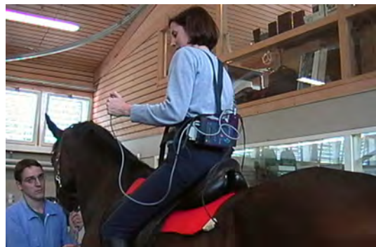
Abb. 5A: Ein Pferd ist mit der roten Sattelmessdecke ausgerüstet und die Reiterin trägt den Recorder wo die Messungen aufgezeichnet werden am Gurt.

Abb. 5B: «Magic mountain» Rekonstruktion der Kräfte welche die Reiterin auf den Rücken des Pferdes überträgt. Die rechte Seite ist etwas mehr belastet.