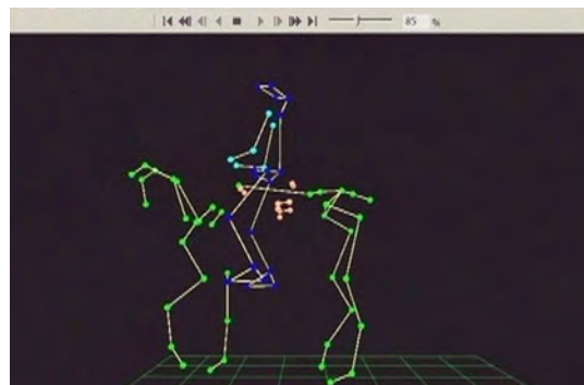
Abb. 4B: Das stilisierte Bild von Pferd und Reiter, welches von allen Winkeln drei-dimensional analysiert werden kann – auch von unten.