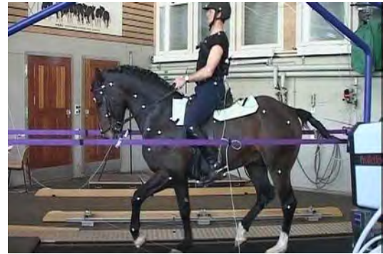
Abb. 4A: Pferd mit Reiter auf dem Laufband. Wichtige Punkte für die Erfassung von Pferd und Reiter sind mit reflektierenden Kugeln markiert. Die Hufe sind mit feinen Gummifäden und Winkelmessern ausgerüstet, um die Zuordnung der einzelnen Hufe bei der Kraftmessung zu ermöglichen. Ganz rechts ist eine der 6 miteinander gekoppelten Kameras ersichtlich.

Präsident Verein Forschung für das Pferd Dr. iur. Anton W. Blatter